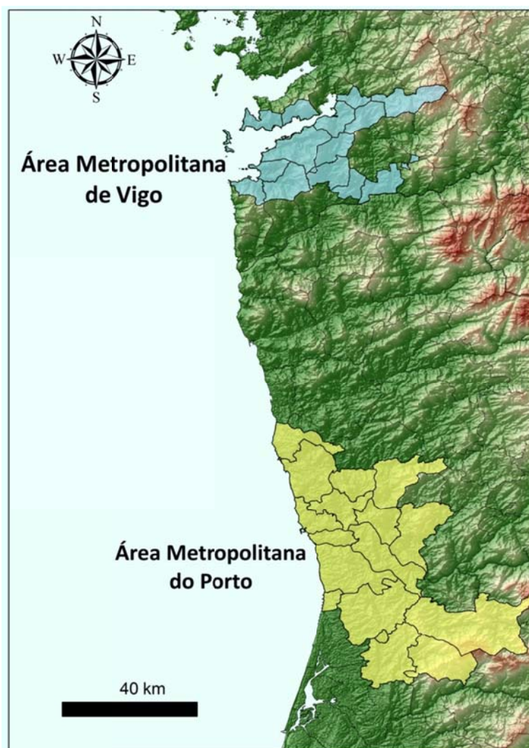
Figura 1. Mapa de localización das áreas metropolitanas legalmente constituídas de Vigo e de Porto no noroeste ibérico

2.089 km 2 e unha poboación de preto de 1,8 millóns de habitantes (Ver Cadro 1 e Figuras 1 e 3). A Lei 75/2013 do Goberno Portugués legisla na cooperación municipal, contemplando dúas áreas metropolitanas, a de Lisboa e a de Porto e, actualmente, a área Metropolitana do Porto é unha realidade resultante dun proceso de adhesión de municipios e dunha cooperación intermunicipal anterior ás leis máis recentes que afectaron á mesma. O seu funcionamento reflíctese en diversos aspectos, entre os que destaca o sistema de transportes públicos, planeado cunha concepción supramunicipal xa desde o século XIX, como ben sinalou Pacheco (1992).