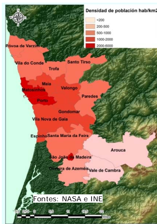
Figura 3. Densidade de poboación nos municipios do área metropolitana de Porto.