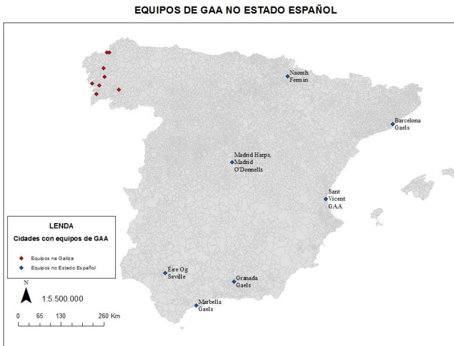
Mapa 1.1. Distribución dos equipos de GAA no Estado español.